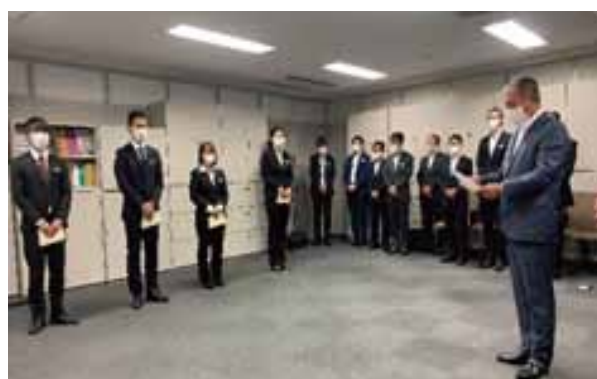
■本社での本配属式

約3ヶ月の店舗研修が8月末で終了し、9月から本配属がスタートしました。 どこの店舗配属になるのか？ 新しい場所へ行っても大丈夫なのか？など 楽しみと不安でいっぱいな新入社員達。 本社で行われた本配属式では、仮配属とは違う店舗での勤務に向けての緊張感が感じられました。